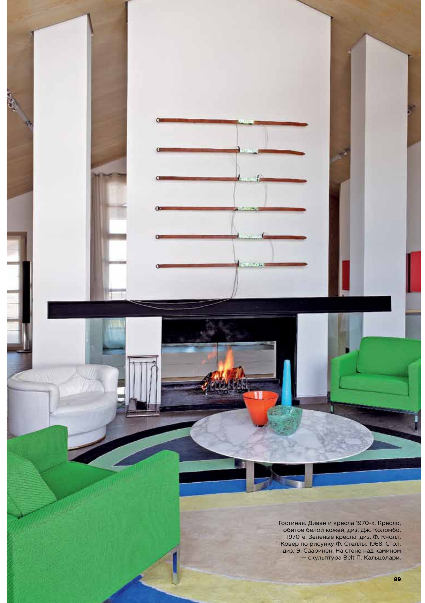
Гостиная. Диван и кресла 1970-х. Кресло, обитое белой кожей, диз. Дж. Коломбо. 1970-е. Зеленые кресла, диз. Ф. Кнолл. Ковер по рисунку Ф. Стеллы. 1968. Стол, диз. Э. Сааринен. На стене над камином — скульптура Belt П. Кальцолари.