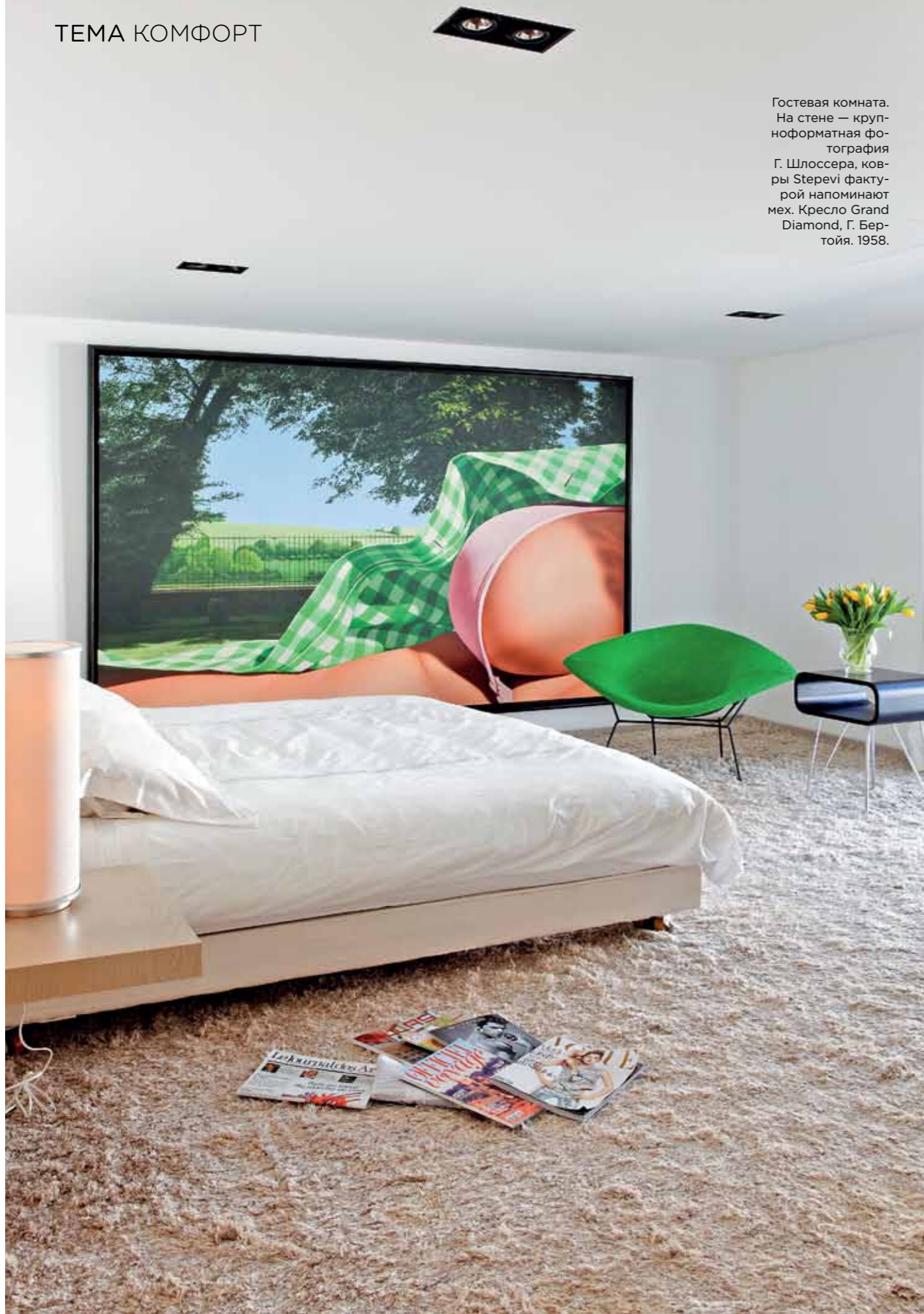
Гостевая комната. На стене — крупноформатная фотография Г. Шлоссера, ковры Sterevi фактурой напоминают мех. Кресло Grand Diamond, Г. Бертойя. 1958.